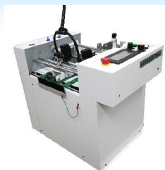
② 单张送纸器 明信片~A4幅印刷物