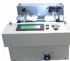
⑥ 下读取型检查装置