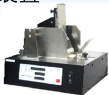
① 任意厚度印刷物供给装置