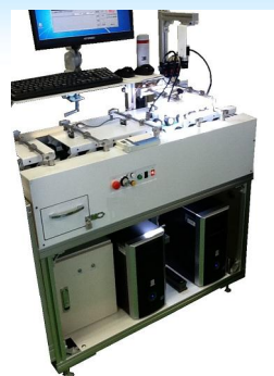
⑦ 上下读取型编号检查装置