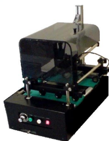
⑤ 上读取型检查装置